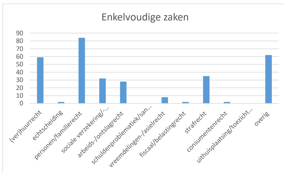
Figuur 2. Juridische component in 281 enkelvoudige zaken.

Daarnaast is relevant om te vermelden dat maar liefst 213 zaken zijn aangemeld door Sociale Buurtteams van de gemeente Heerlen, 60 zaken door Expertiseteams en 7 zaken door overige partijen.